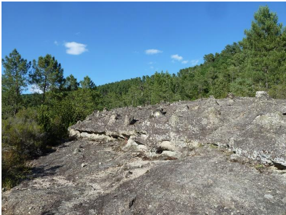
Vernon : les tétines

Après-midi : randonnée géologique autour de Vernon.