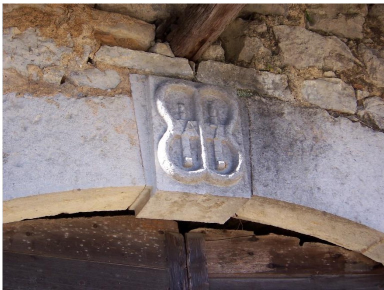
Au mas de l'Abeille