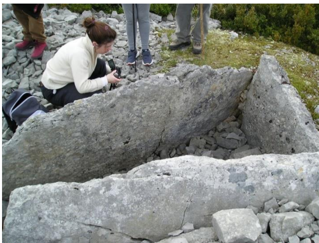
Examen d'un dolmen – secteur de Fontgraze