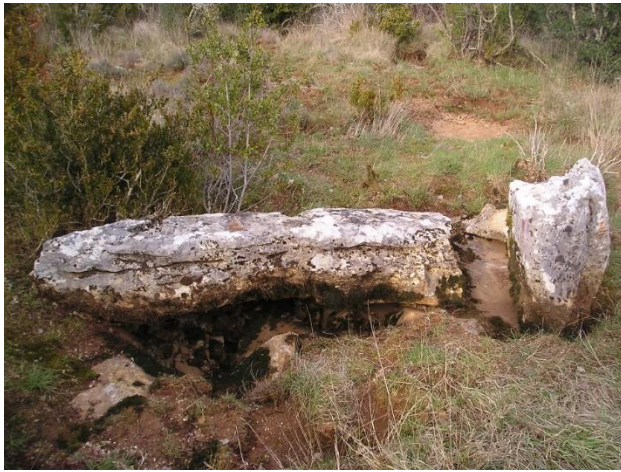
Le menhir couché – secteur de Fontgraze