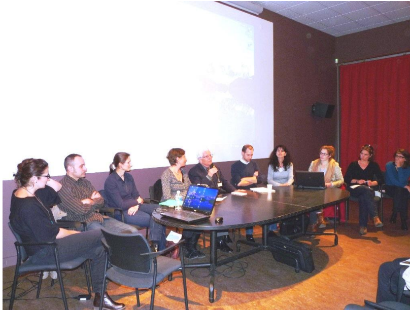
20 février 2015 – soirée d'ouverture à Orgnac