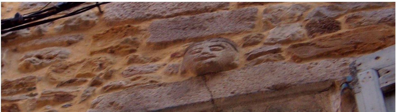
Vu aux Vans