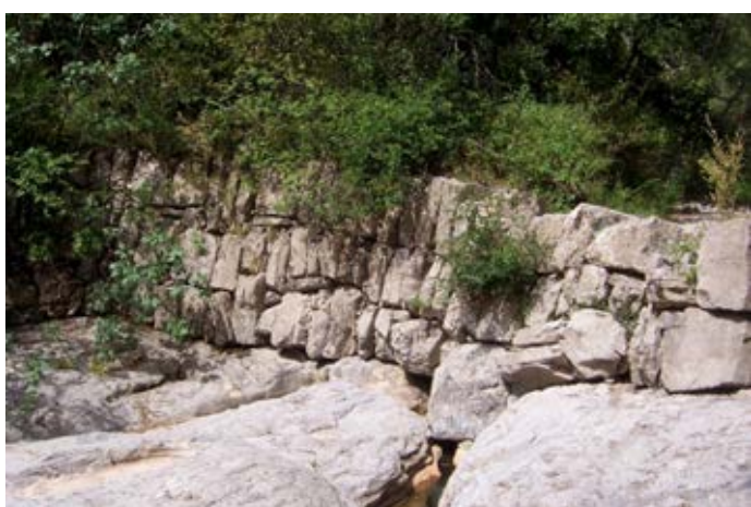
Granzon : une impressionnante levade