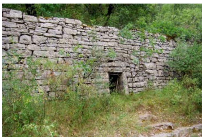
Granzon : un beau mur de terrasse avec abri