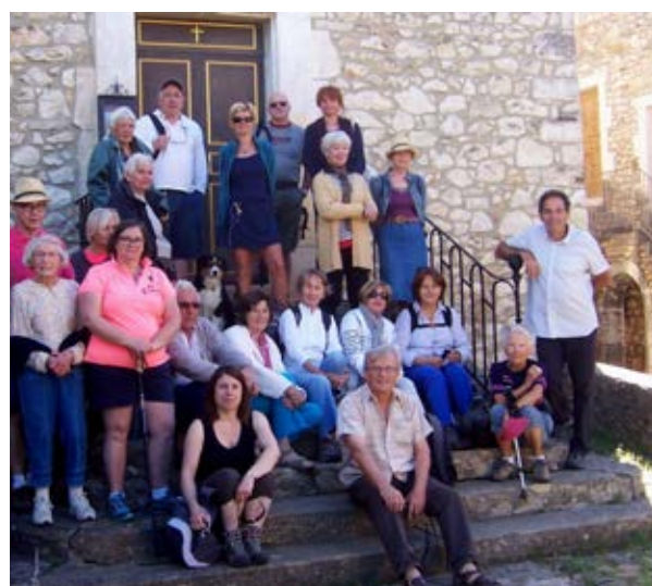
A Rochegude avec les organisateurs